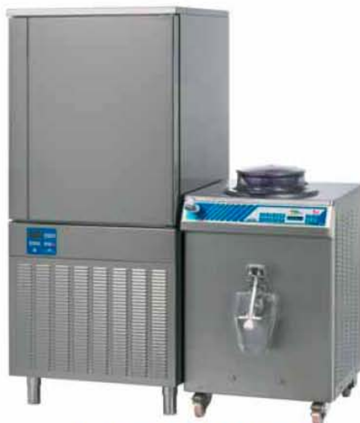
Nordika 300 Pasticceria