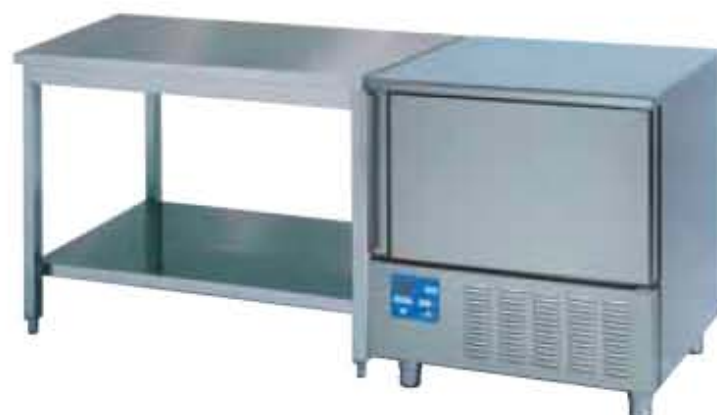
Nordika 100 Gelateria