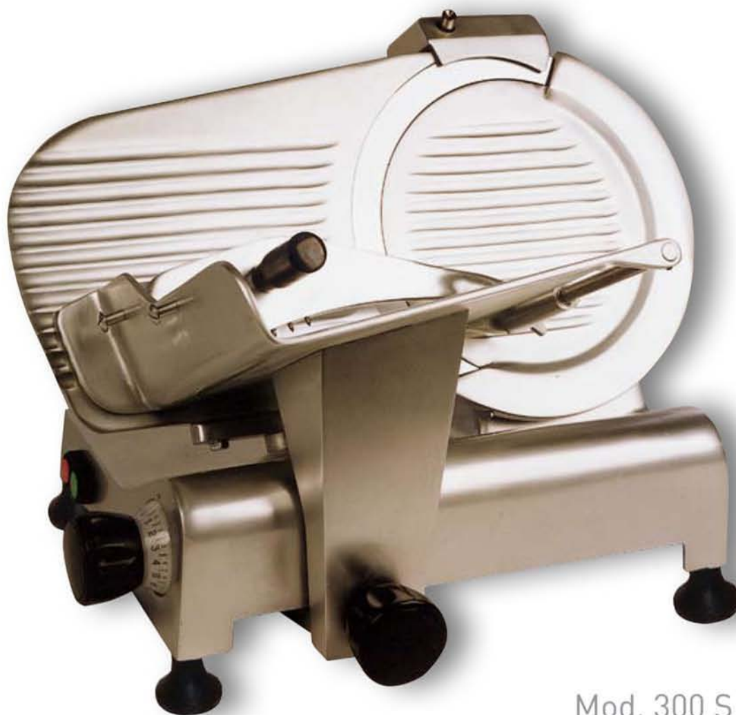
Mod. 300 S

Construidas en aleación de aluminio anodizado