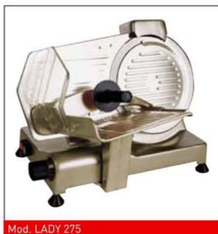
Mod. LADY 275