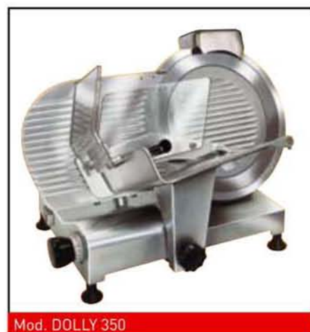
Mod. DOLLY 350